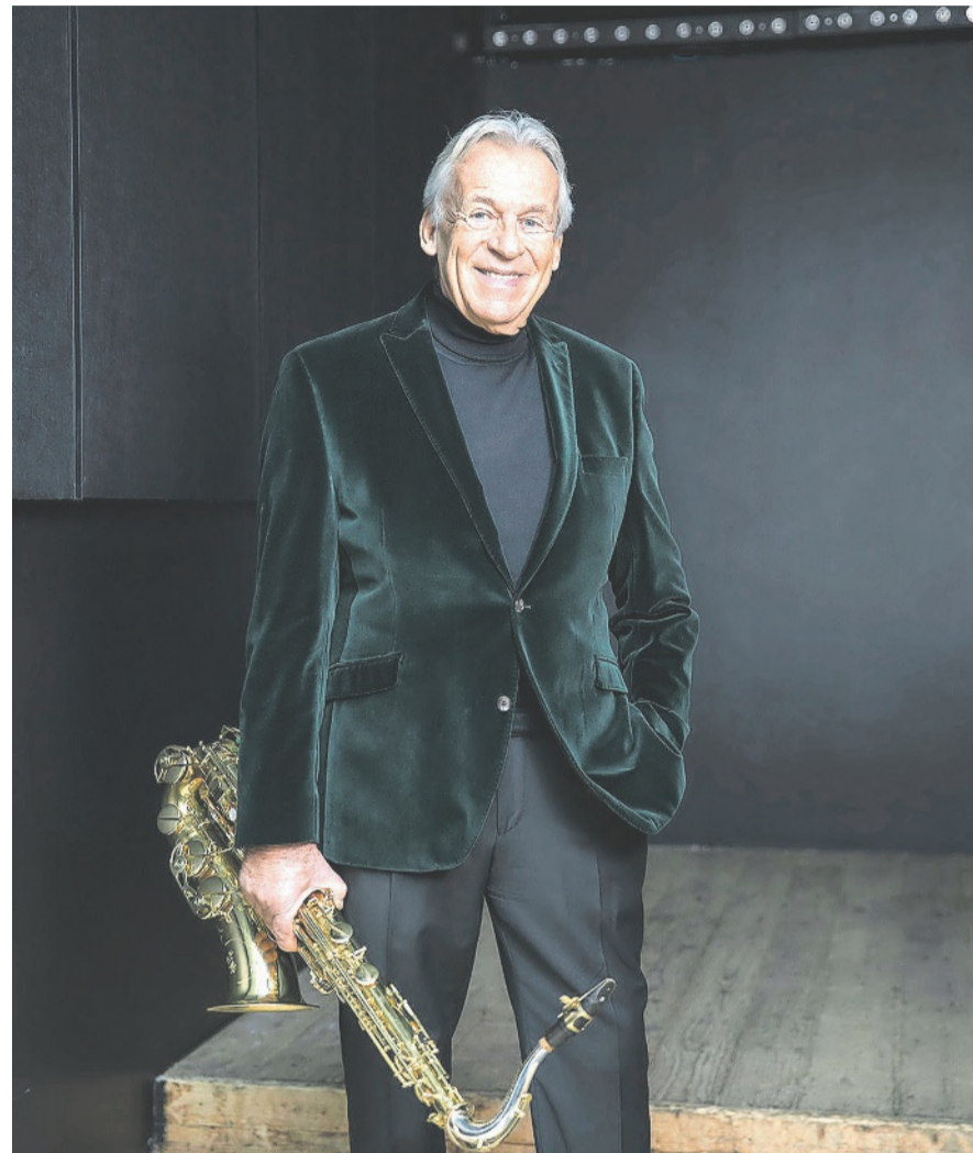
Pepe Lienhard geht mit seinem neuen Album «Music was my first love» auf grosse Tournee und präsentiert seine musikalischen Highlights aus über 50 Jahren in neuem Gewand.

Keine Korrespondenz über die Verlosung. Rechtsweg ausgeschlossen. Die Gewinner der Verlosung werden dem Ausschreiber bekannt gegeben.