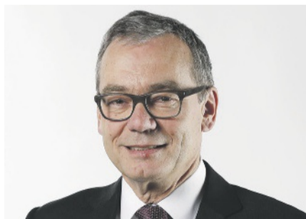
Ruedi Noser Ständerat FDP/ZH

«Die Schweiz kennt vor allem regionale Bräuche und Kulturen. Die einzige nationale Kultur ist der Schweizer Film. Dafür lohnt sich unser Engagement.»