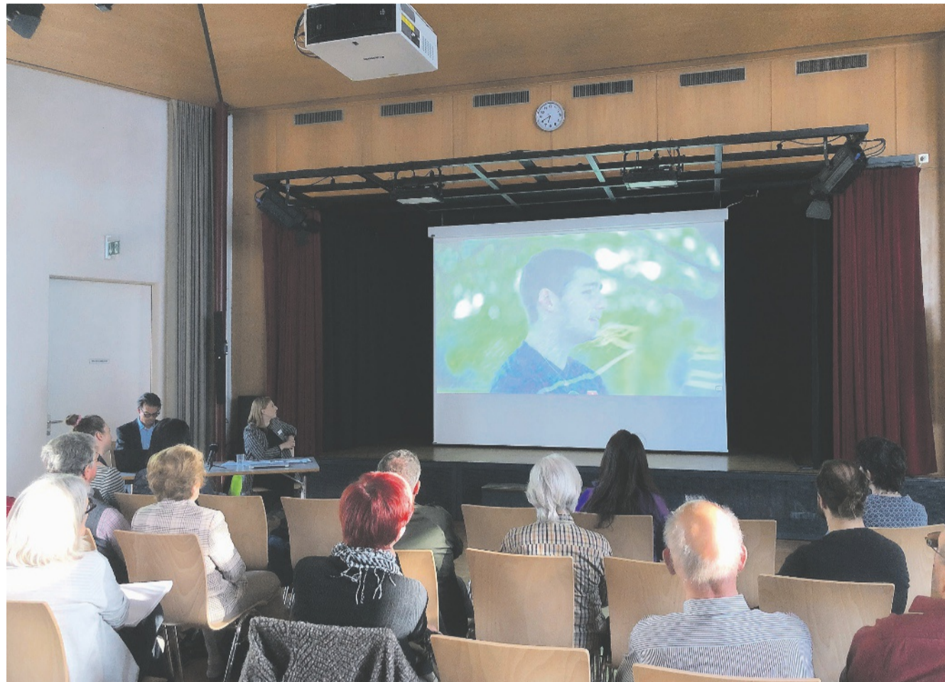
Am Vortrag zur Suizidprävention gab es erschreckende Zahlen: Pro Jahr nehmen sich in der Schweiz etwa 1000 Personen das Leben.

Hinschauen hilft: Rund 80 Prozent der suizidgefährdeten Menschen senden Notsignale aus, bevor sie sich was antun wollen. «Das können schriftliche Hin-