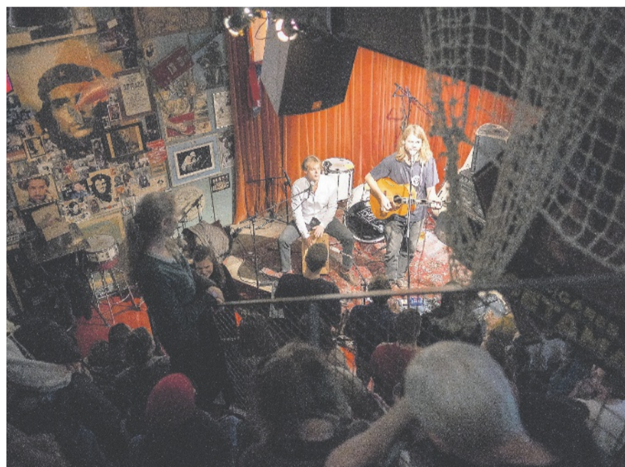
Das Lauter Festival findet bereits Anfang Mai in der Gessnerallee statt.