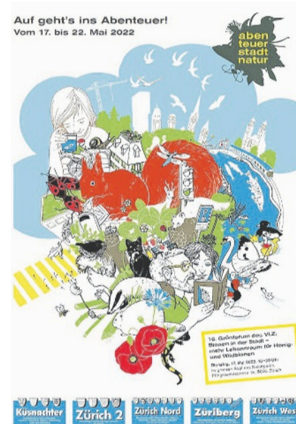
Das spielerisch gestaltete Cover der Sonderzeitung «Abenteuer Stadtnatur». Sie liegt dieser Zeitung bei.

gang asphaltiert werden musste. Immerhin hat Maggi stets Saatgut dabei und sorgt so für mehr Grün, wo auch immer es geht. Lorenz Steinmann