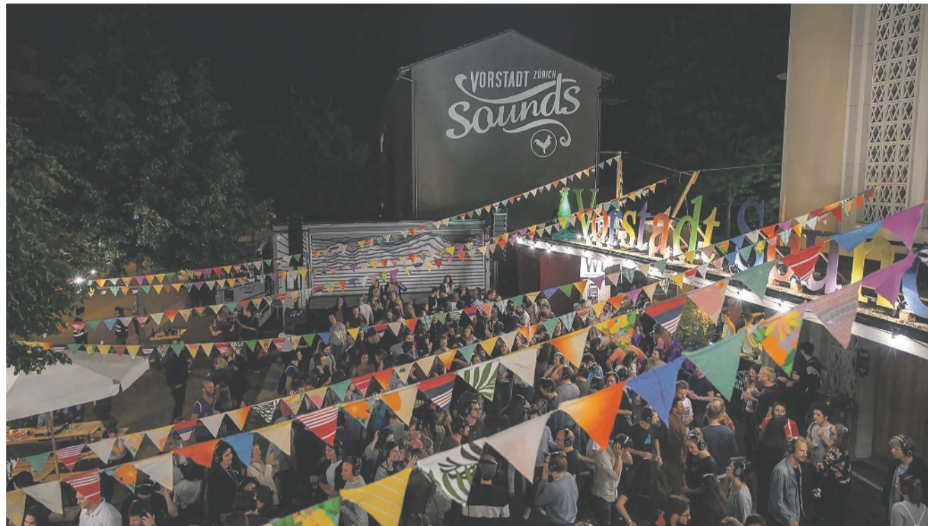
Das Vorstadt Sounds Festival ist zurück auf den Strassen von Albisrieden und trumpft erneut mit einem starken Festival-Programm auf.

«Das 14. Lauter Festival findet am 6. und 7. Mai auf drei Bühnen in der Gessnerallee