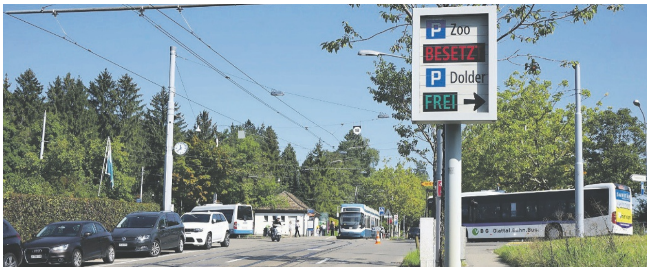
Im Zoo-Quartier herrscht aufgrund der Parkplatzsituation seit Jahren grosse Unzufriedenheit. Ein neues Parkhaus soll Abhilfe schaffen.