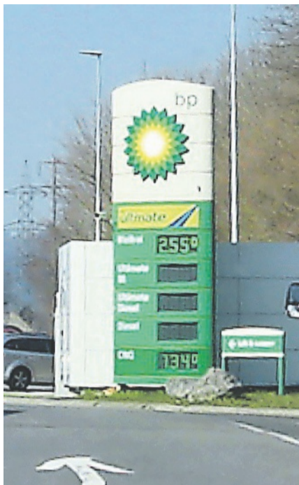
Hier war der Treibstoff teuer: Raststätte Glarnerland Richtung Zürich an der A3 bei Weesen (I). Gilt auch für die Shell-Tankstelle vis-à-vis Richtung Chur. Rechts der Treibstoffpreis am selben Tag im Dorf Weesen.

Der Verfasser fuhr am Folgetag erneut Richtung Glarnerland, und siehe, die Preistafel nach, statt vor den BP-Zapfsäulen