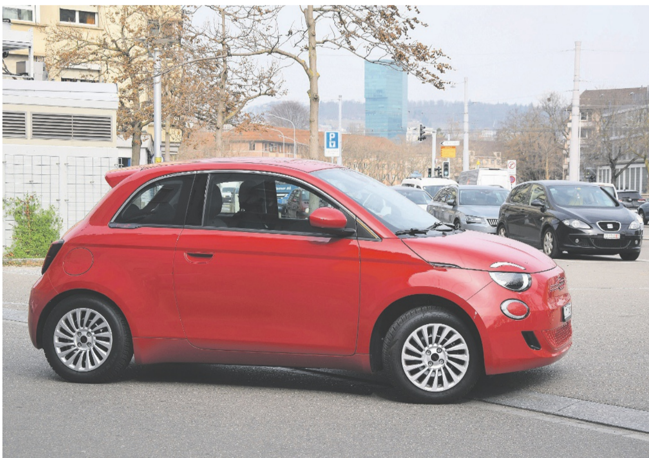
Fiat 500 e 2022: 3,65 m lang, 1,74 m breit. Zum Vergleich der Cinquecento 1975: 2,97 × 1,32 m.

Der elektrische Cinquecento ist der vermittelnd sympathische Individualist. Dass zu Hause in der Garage vielleicht noch ein Ferrari und/oder Range Rover parkt, sieht man ja nicht. Der Charakter