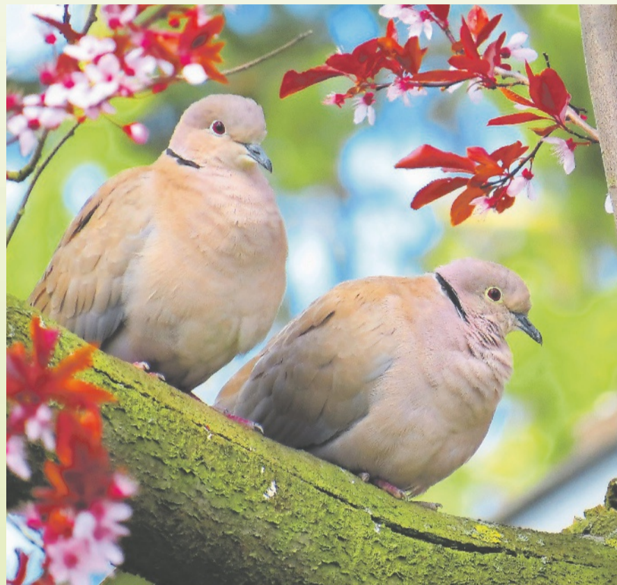
Kein Monat feiert die Liebe so sehr wie der Mai.