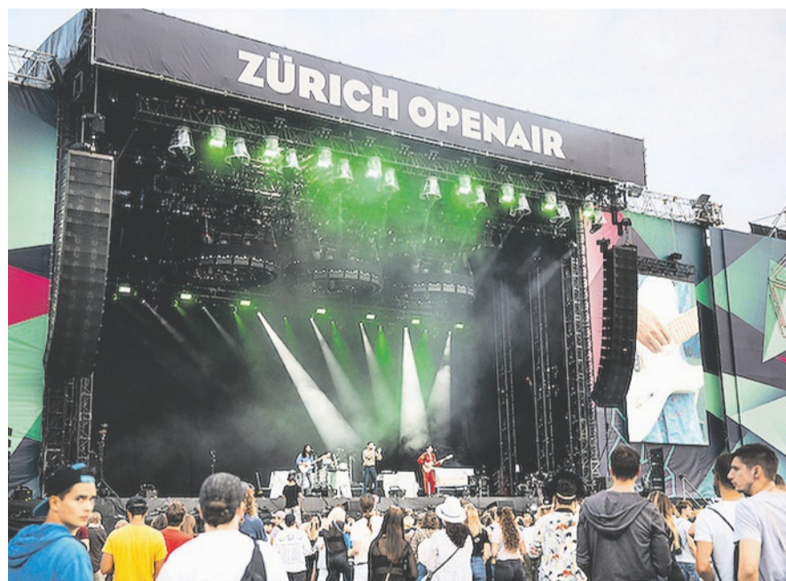
Das Line-up für das Zürich Openair ist bereits komplett.

Anders sieht es beim Werdinsel Openair aus. Entgegen der Vorankündigung der Veranstalter findet das Festival dieses Jahr «aus organisatorischen Gründen» nun doch nicht statt, wie es auf Nachfrage heisst. Die Pandemie habe dabei auch ihren Beitrag geleistet. Im Sommer 2023 soll es dann aber wieder ein Werdinsel Openair geben, so das Versprechen.