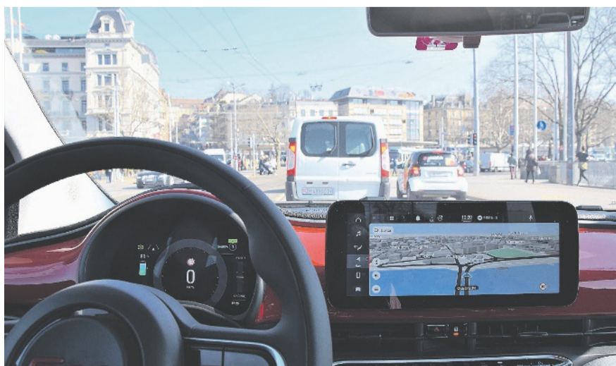
Instrumente wie ein Grosser, farbenfrohe Umgebung. Rechts: Für Kinder reichs, die Sicht nach vorn ist beschränkt.