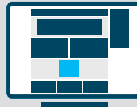
Rectangle Desktop 300 x 250 px