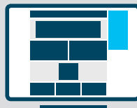
Halfpage nur Desktop 300 x 600 px