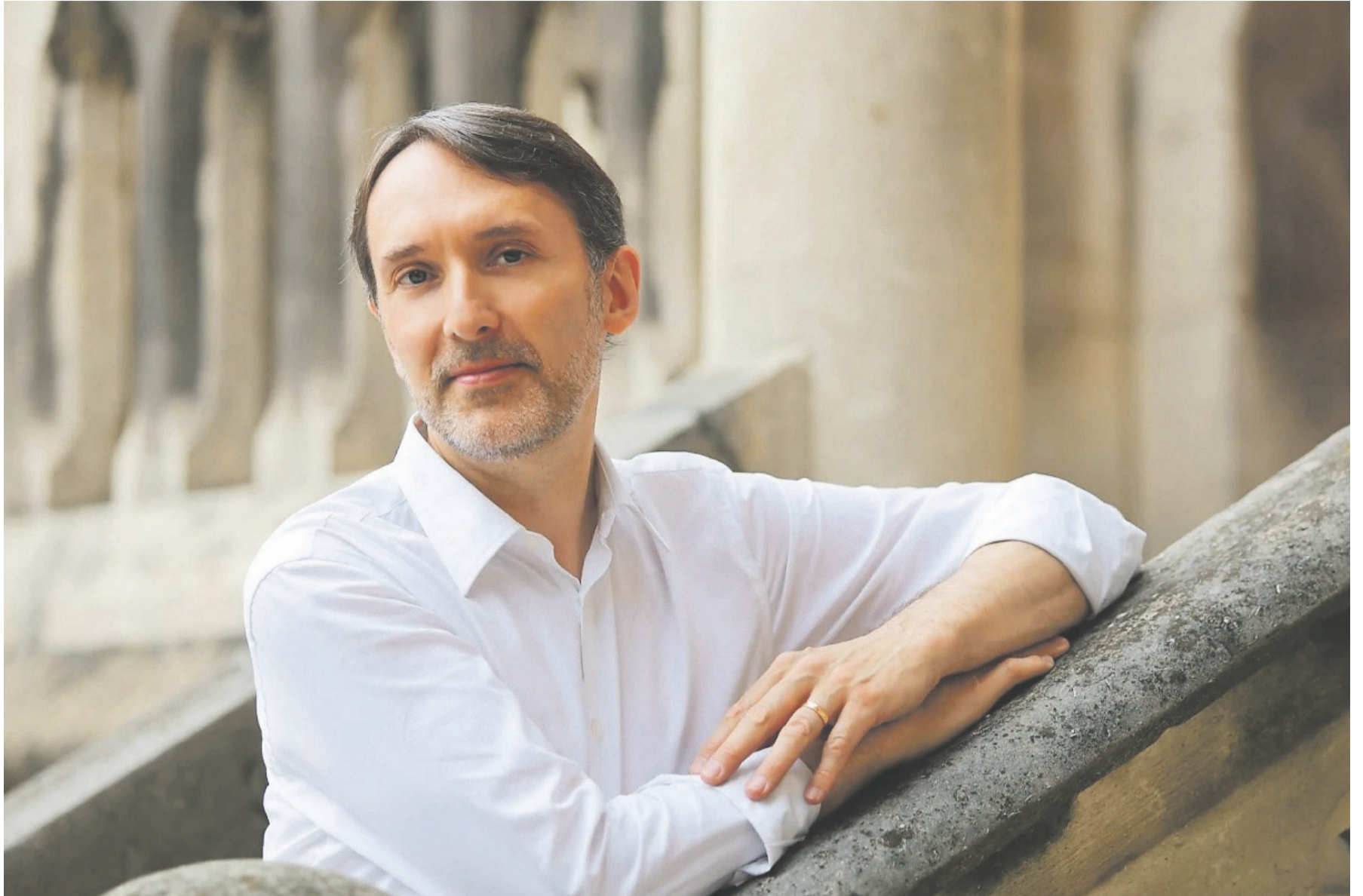
Der französische Organist, Improvisator und Musikpädagoge Olivier Latry wurde 1995 zum Professor für Orgel am Pariser Konservatorium ernannt.