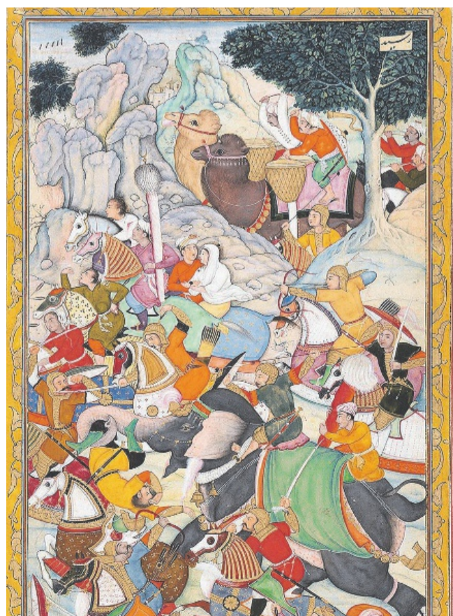
Bildausschnitt des Gemäldes «Angriff auf Flüchtende», das dem indischen Maler Dharam Das zugeschrieben wird.

plünderte Tausende von Ritual- und Prestigeobjekten aus dem Palast. Doch Benin ist nicht nur für seine koloniale Vergangenheit bekannt. Es blickt vielmehr auf eine lange, mit Europa eng verflochtene Geschichte zurück und steht für eine hochwertige Kunstproduktion von Objekten aus Messing, Elfenbein, Terrakotta oder Holz, die bis heute lebendig ist. Die