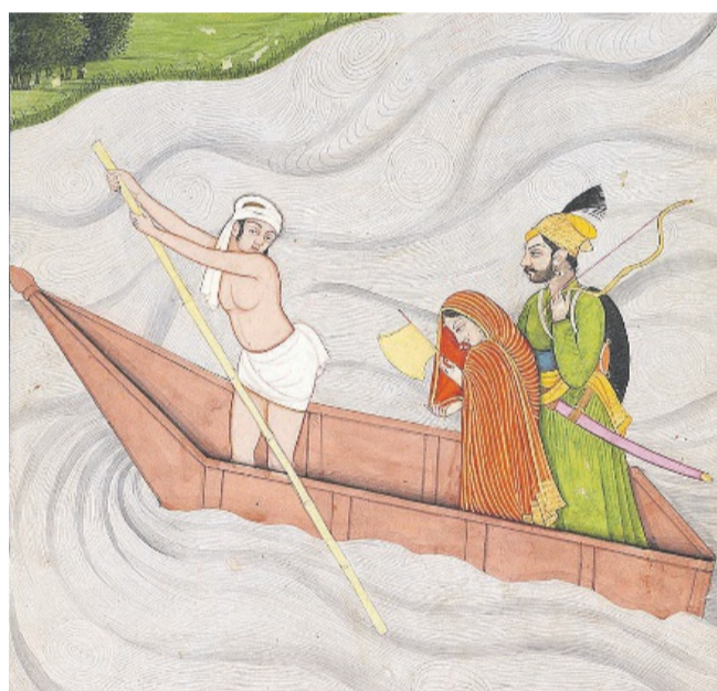
Ausschnitt des Gemäldes «Reise in eine schöne Zukunft».