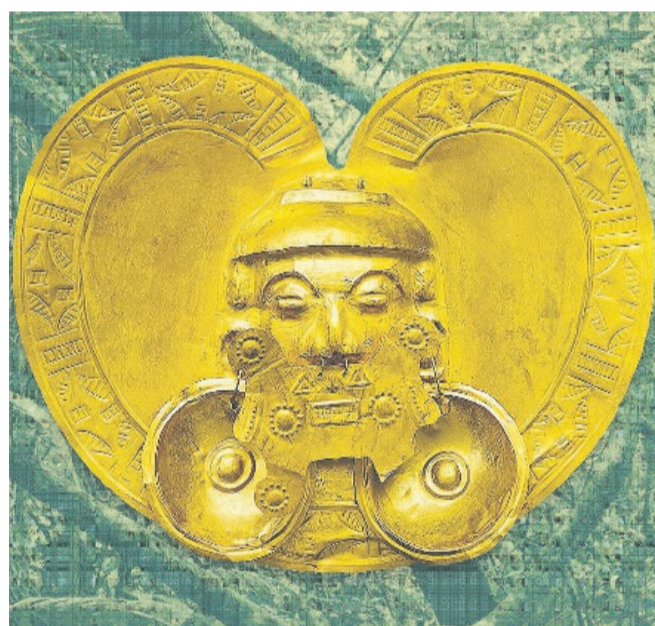
Brustplatte mit Gesicht aus Kolumbien.