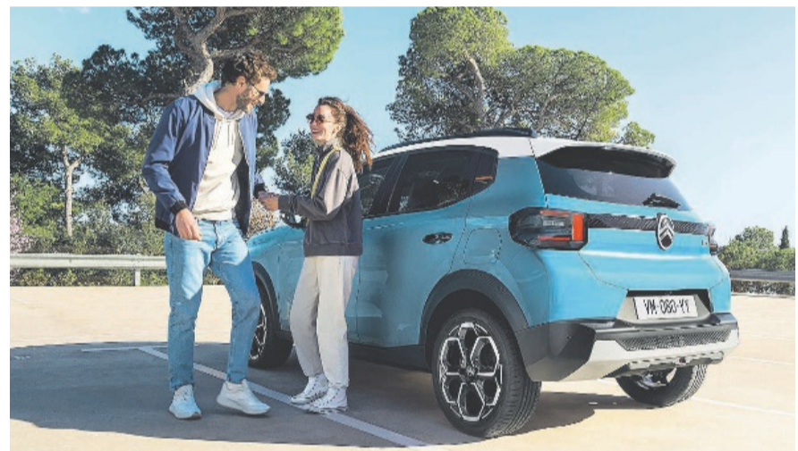
Viele Varianten: Der neue Kleinwagen kommt mit Benzin- und Hybridmotoren.

So bietet der neue C3 eine optimale Synthese aus Design, Komfort und Technologie, ohne dabei auf eine attraktive Preispositionierung zu verzichten. Der neue C3 ist ab 15 690 Franken als 1,2-Benziner mit 100 PS und Schaltgetriebe erhältlich. Die ersten Auslieferungen sind für den Sommer 2024 geplant. Die Hybrid-100-Version wird später im Jahr 2024 bestellbar sein. (pd.)