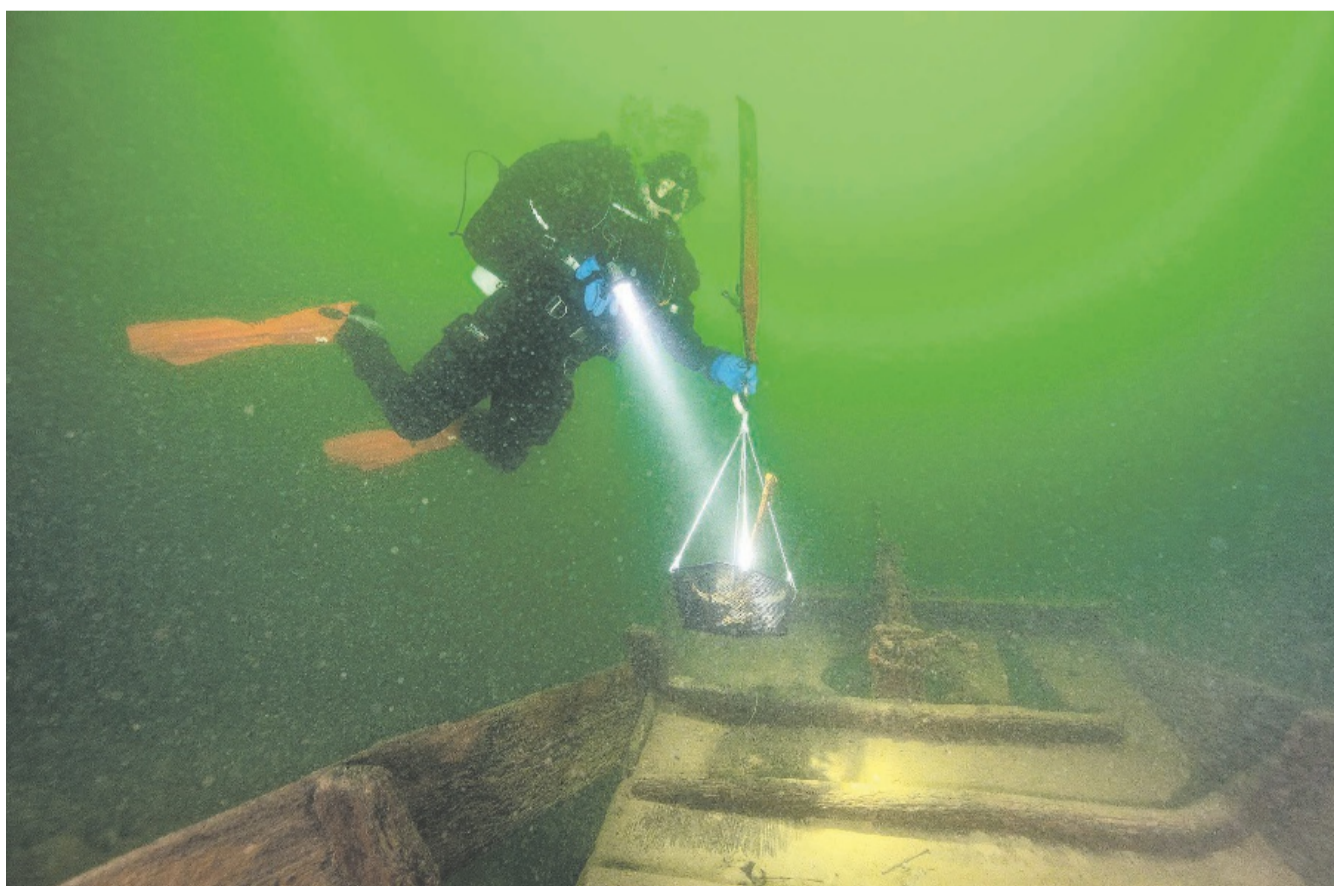
In einem Korb an einem Bergeballon werden vor Stäfa Artefakte für den Transport an die Wasseroberfläche vorbereitet.