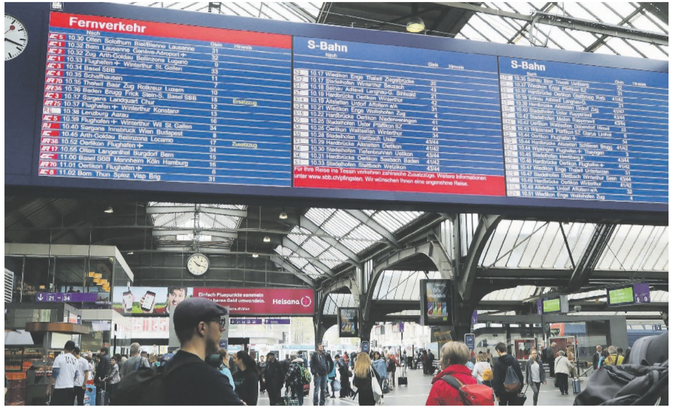
Die SBB empfehlen Kundinnen und Kunden, ihre Reise frühzeitig zu planen und Sitzplätze zu reservieren.

Um auch der erhöhten Nachfrage nach Reisen in Richtung Italien anlässlich der Auffahrtsbrücke nachzukommen, wird das Angebot der TILO-Regionalzüge (Treni