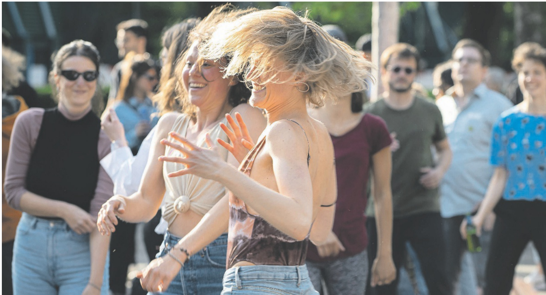
Einfach mal tanzen: Das Festival «Zürich Tanzt» macht im Mai lokales, nationales und internationales Tanzschaffen hautnah in der Stadt Zürich erlebbar.