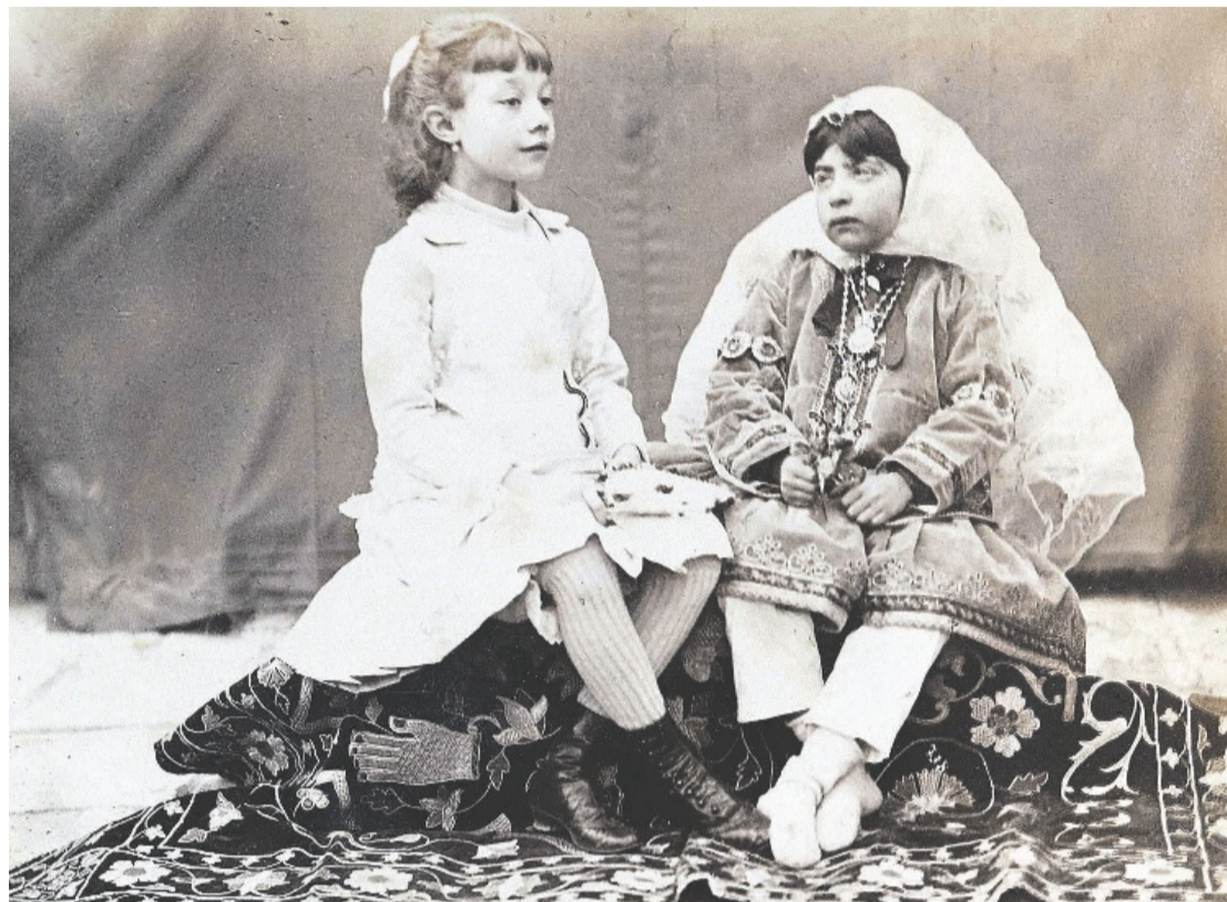
Zwei Mädchen in europäischer und in persischer Kleidung, um 1880–1896.

Das Königtum Benin im heutigen Nigeria steht im Zentrum der Debatte um die Rückgabe von geraubtem Kulturgut aus Afrika. Im Jahr 1897 eroberte die britische Armee dessen Hauptstadt Benin City und