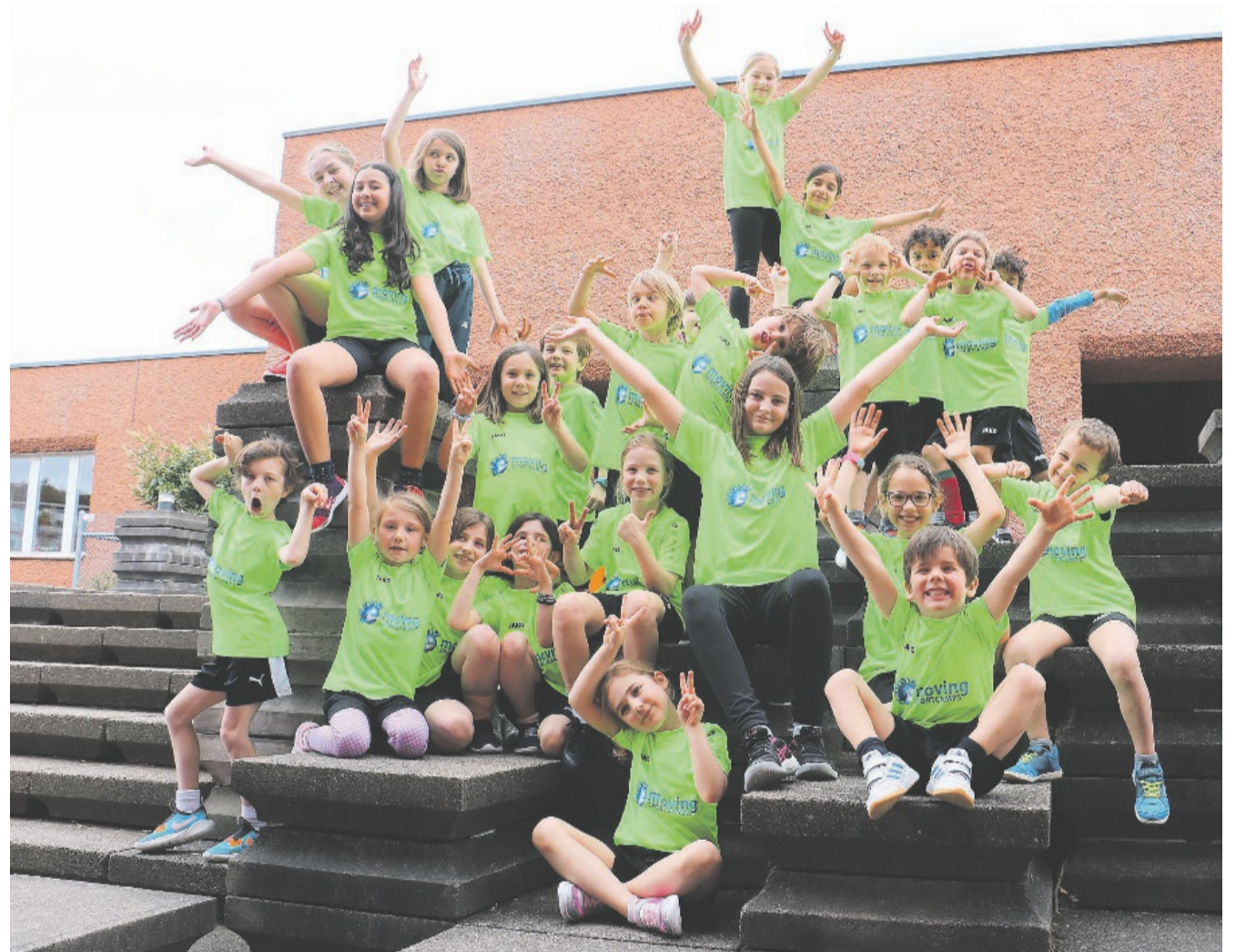
Der Fototermin auf dem Pausenplatz bot den Kindern eine kurze Verschnaufpause zwischen all der Bewegung.

Es ist das erste Mal, dass ein «moving Sportcamp» in der Gemeinde Küssnacht durchgeführt wird: «Wir wurden von Eltern aus Küssnacht kontaktiert mit der