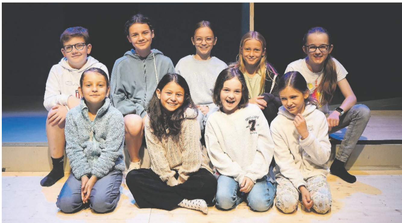
Die Kinder der Jungen Bühne des Atelier-Theaters Meilen befinden sich mitten in der Intensivprobeweche.

Samstag, 11. Mai, 18 Uhr, Sonntag, 12. Mai, 17 Uhr, Mittwoch, 15. Mai, 19.30 Uhr, Atelier-Theater Meilen, HeuBühne, General-Wille-Str. 169, 8706 Feldmeilen. Eintrittspreise: CHF 30.–/20.– ATM-Mitglied/15.– Studenten/Jugendliche/Kinder. Reservierungen und weitere Informationen unter: www.ateliertheater-meilen.ch oder per Telefon 077 432 90 41.