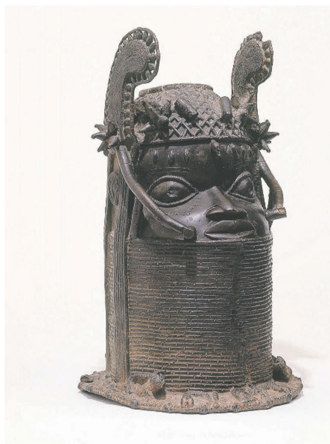
Gedenkkopf des Oba Osemwende, Uhumwu Elao, königliche Gilde der Bronzgieässer am Hof von Benin.